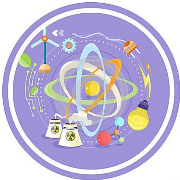
La Física encuentra soluciones para un mundo mejor

La Física es clave en el desarrollo humano por ser, no solamente la ciencia capaz de explicar cuestiones básicas relacionadas con el origen del universo y de la materia, sino también por ser, en la actualidad, uno de los motores de la innovación tecnológica (materiales, fuentes de energía, comunicaciones, nuevos dispositivos, etc.).