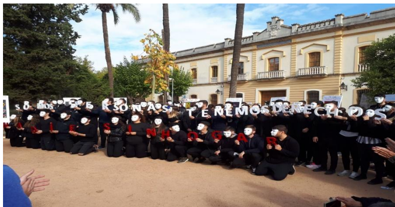
Figura 2 : Representación de las Vidrieras en el Acto de sensibilización de calle. Elaboración propia.

La representación de las vidrieras fue el día 23 de noviembre, día internacional de las PSH, donde el alumnado participó en el acto organizado por la propia Cáritas Diocesana (véase figura 2).