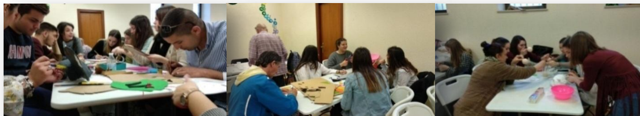
Figura 3. Grupos de trabajo cooperativo en el aula.

La actividad se desarrolló en grupos de trabajo cooperativo y de forma conjunta entre el alumnado y algunas personas PSH, que ejercieron de voluntarios en los grupos de trabajo de forma interactiva, para elaborar todo el material necesario y acorde con la escenificación: máscaras, marionetas, vestuario y atrezzo. (Véase figura 3).